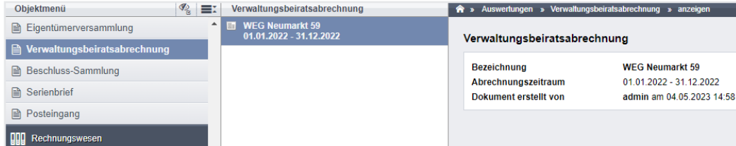
Abb. 326: Verwaltungsbeiratsabrechnung